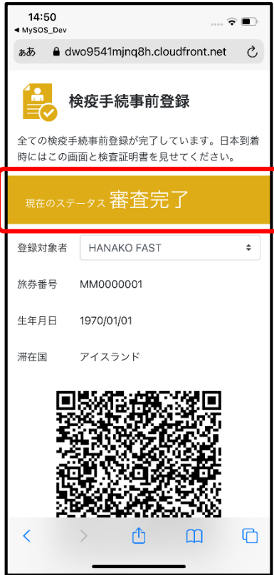
ステータス: 審査完了 背景色: 黄色