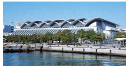
マリンメッセ福岡A館