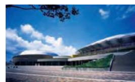
アクアドームくまもと