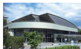
総合西市民プール