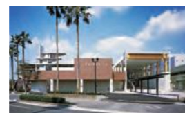
鴨池公園水泳プール