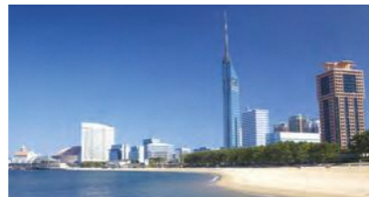
シーサイドももち海浜公園